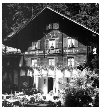
Waldgasthaus Chalet Saalhöhe