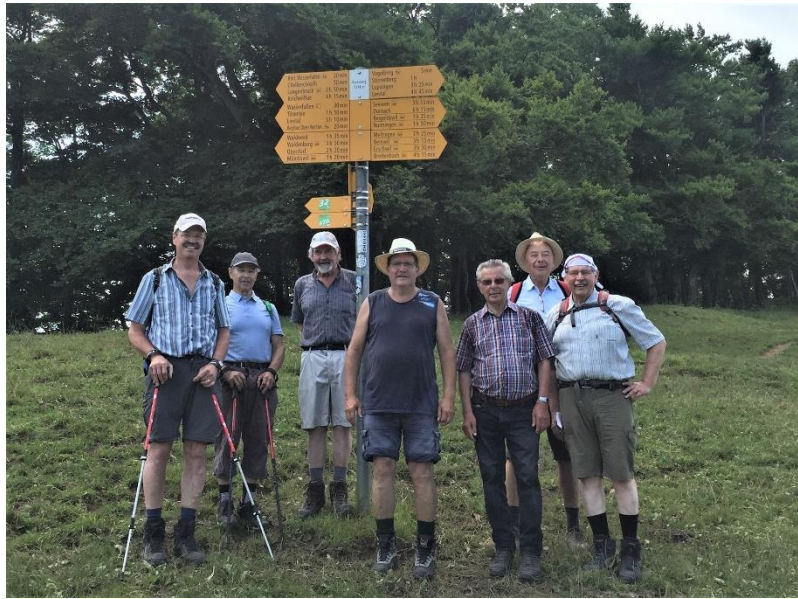
Die glorreichen Sieben