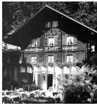
Waldgasthaus Chalet Saalhöhe