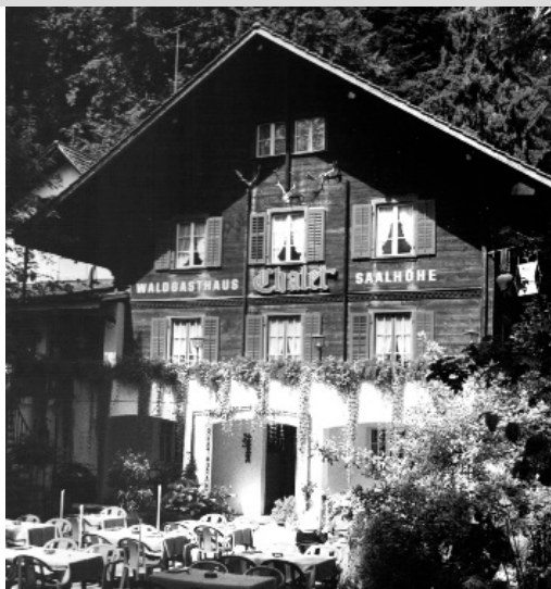
Waldgasthaus Chalet Saalhöhe