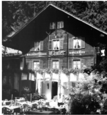
Waldgasthaus Chalet Saalhöhe